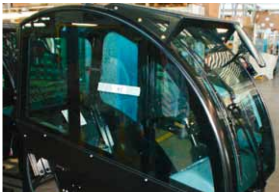
Профиль рамы кабины с превосходным дизайном и наилучшей эргономикой.