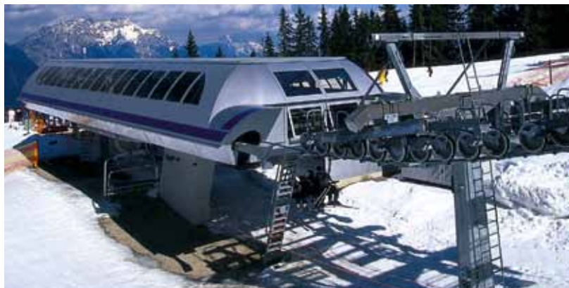
Многokrатно испытанные на качество профили Welsers для станций подъемников.