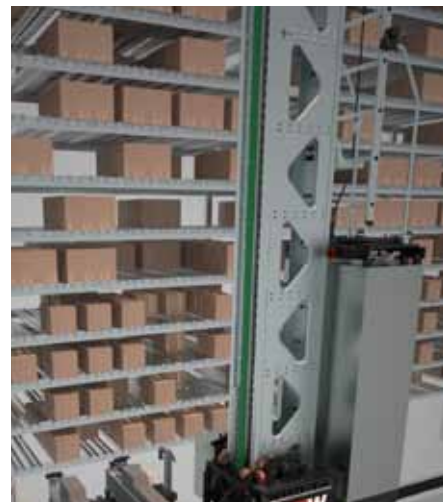
В складском оборудовании также предъявляются высокие требования в отношении стабильности