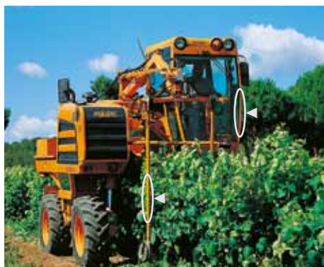
Кабинный профиль, а также валы рольгангов машины для сборки винограда