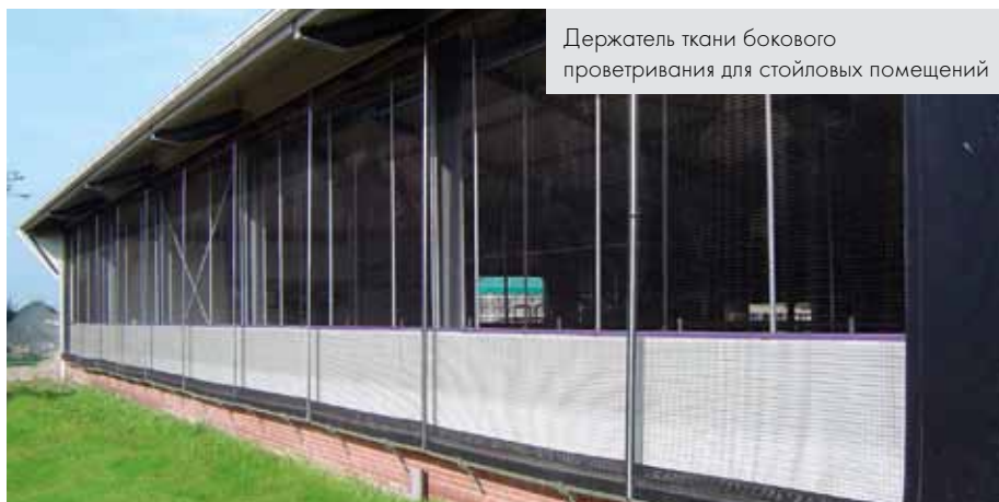
Держатель ткани бокового проветривания для стойловых помещений