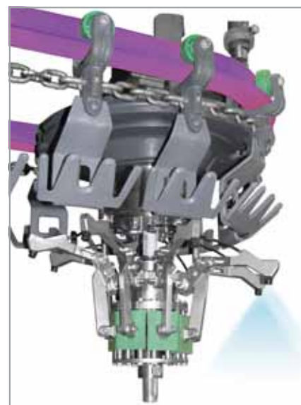
Направляющий рельс (фиолетовый) для транспортной системы скотобойни